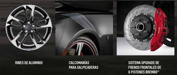
RINES DE ALUMINIO CALCOMANÍAS PARA SALPICADERAS SISTEMA UPGRADE DE FRENS FRONTALES DE 6 PISTONES BREMBO®